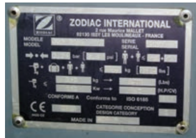
Pláta CE do bhád de Chatagóir “C”

Féach ar Aguisín 7 i gcóir comhairle maidir le hárthaí áineasa a cheannach a thagann faoi réim Threoir 2013/53/AE maidir le hárthaí áineasa agus árthaí uisce.